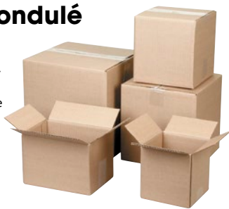
Prix par boîte