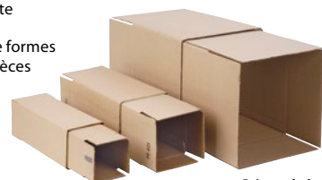
Prix par boîte