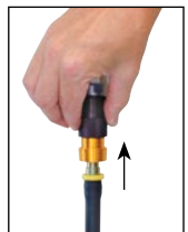
Glisser la douille pour évacuer la pression d'air en aval