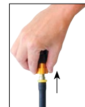
Glisser la bande or pour libérer l'about