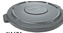
Couvercle plat à pression