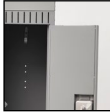
Portes à panneaux doubles, extérieur de calibre 20 et intérieur de calibre 24 (casiers de un et deux niveaux)