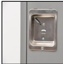
Poignées pour cadenas en retrait, en acier inoxydable Loquet magnétique assurant une fixation solide de la porte lorsque fermée