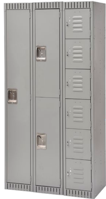
Cadres de calibre 16, corps et tablettes de calibre 24