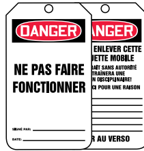
Recto Verso 250/Rouleau SAS452