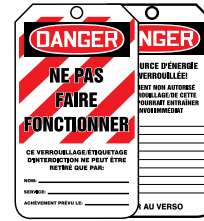
Recto Verso 250/Rouleau SAS453