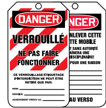
Recto Verso 250/Rouleau SGC242