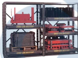
Unité de base et ajout