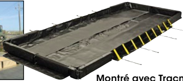
Montré avec Tracmat MC (vendu séparément)