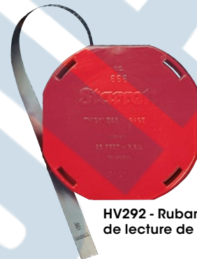
HV292 - Ruban de lecture de 1"